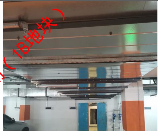
地下车库排烟管道