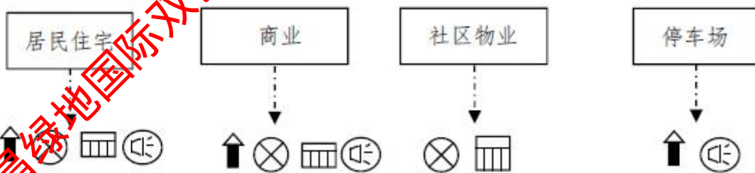
图2-2 施工期产污流程图