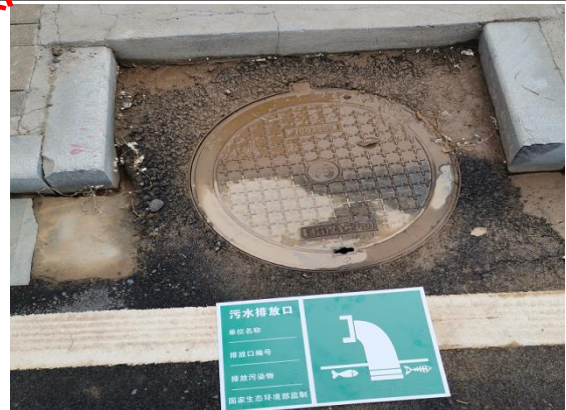
废水排放口环保标识