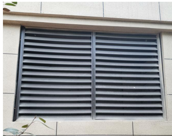
发电机废气排放口