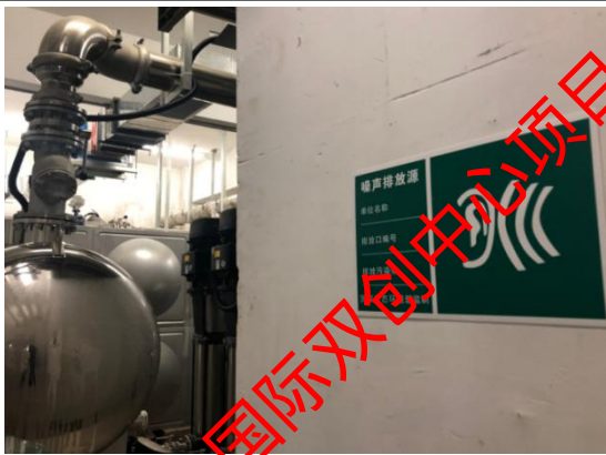
噪声排放源环保标识