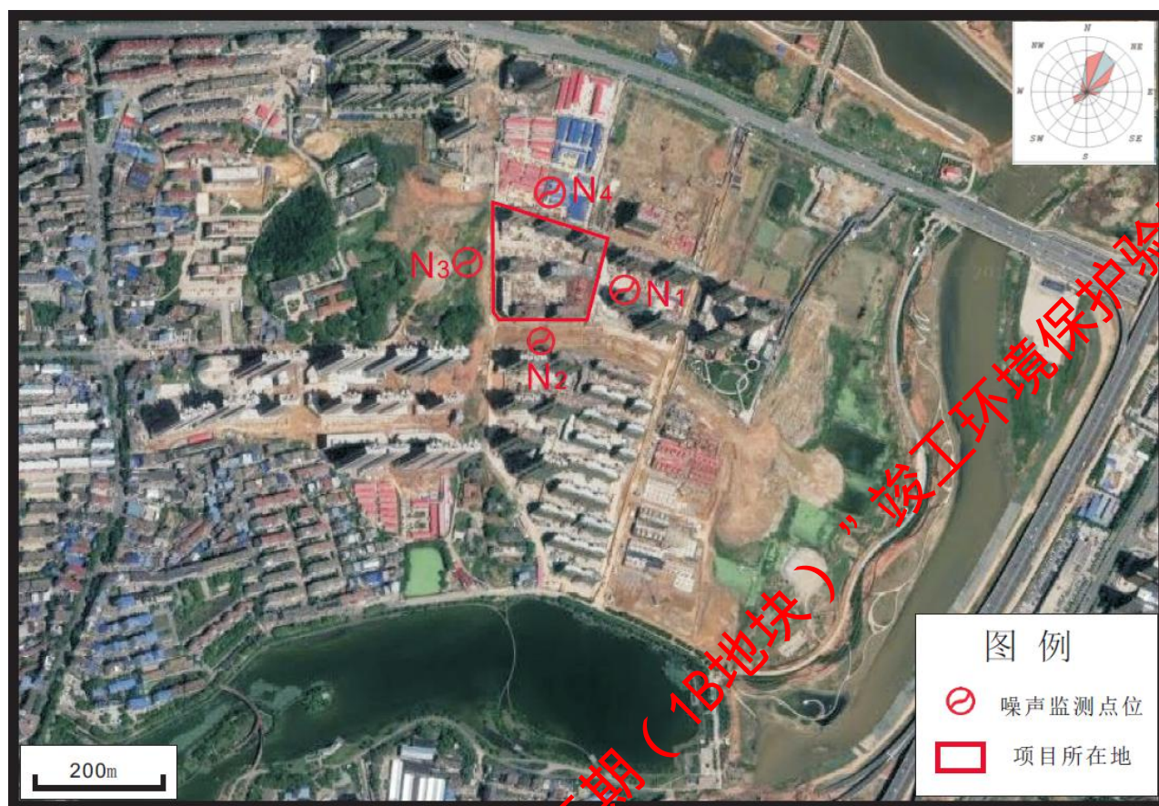
图6-1 噪声监测布点示意图