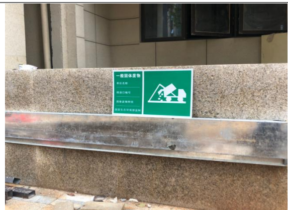
一般固体废物环保标识