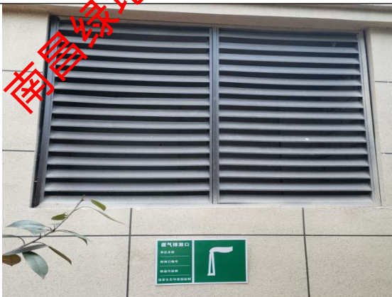
废气排放口环保标识