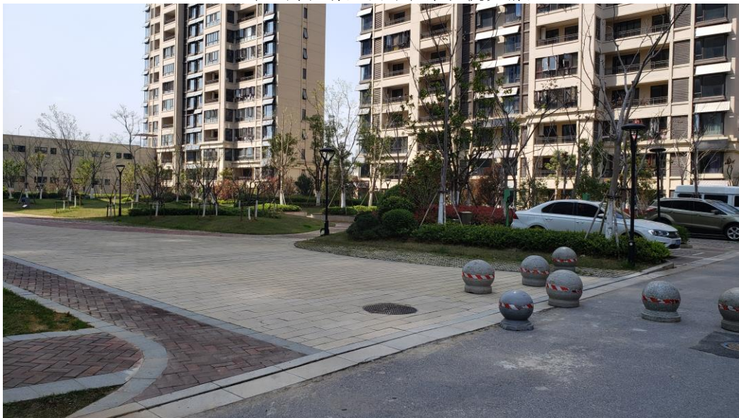
2020年2月现场监测绿化景观恢复情况