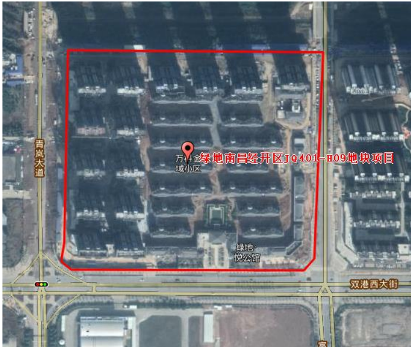
2017年11月施工后期遥感影像图