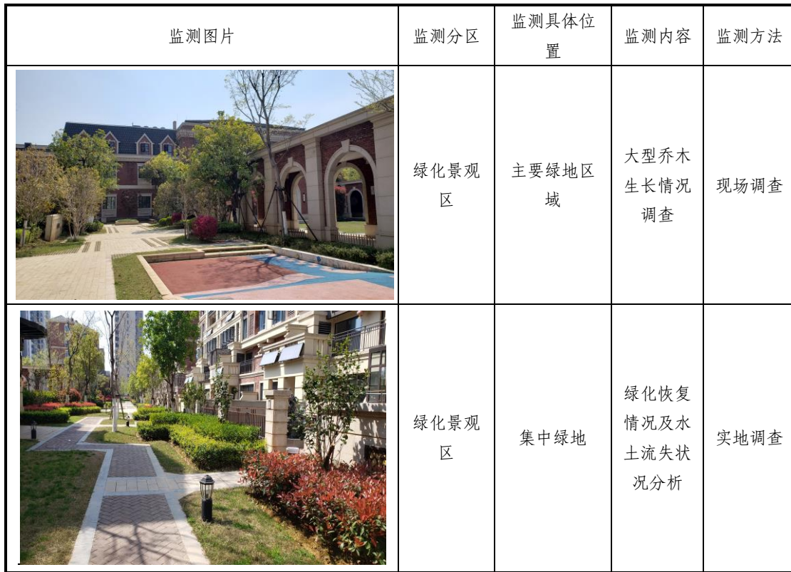
表 1-6 水土保持监测点位情况表