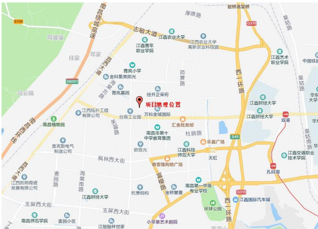
图 1-1 项目区地理位置图

绿地南昌经开区 JQ401-H09 地块项目建设地点位于江西省南昌市经济技术开发区，双港西大街以北、青岚大道以东、富樱路以西、青岚水渠以南。地块中心地理坐标 N28° 44′ 51.89″，E115° 49′ 17.65″。详见下图 1-1 项目区地理位置图。