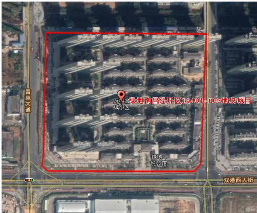
2019年11月完工后遥感影像图