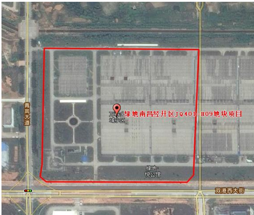
2014年5月扰动前原地貌遥感影像图

遥感监测法综合应用资料搜集、野外抽样调查、遥感解译、模型计算等多种技术方法和手段进行。主要工作环节包括资料准备、野外调查、数据处理、水土流失情况分析与评价四部分。遥感影像变化情况下图 2-1。