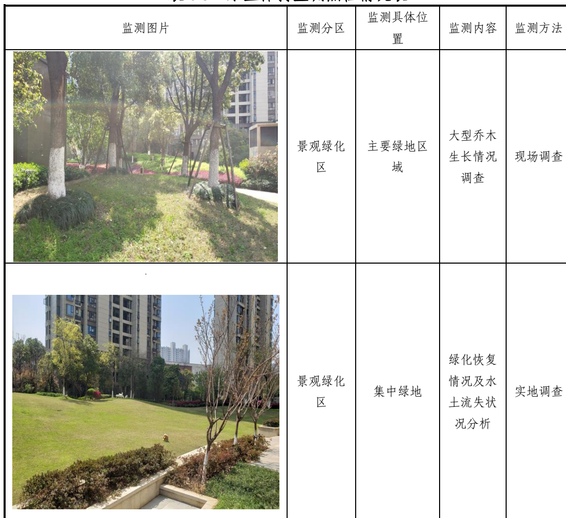
表 6-3 水土保持监测点位情况表