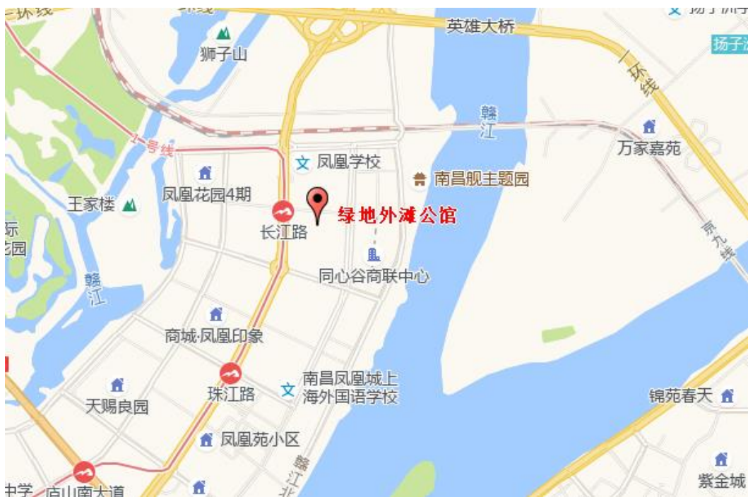
图 1-1 项目区地理位置图

绿地·外滩公馆项目建设地点位于南昌市红谷滩区长江路以南，丰和北大道以东，红谷北大道以西，锦江路以北。地块中心地理坐标东经 115^{\circ}52'37.27'' ，北纬 28^{\circ}43'08.78'' 。详见下图 1-1 项目区地理位置图。