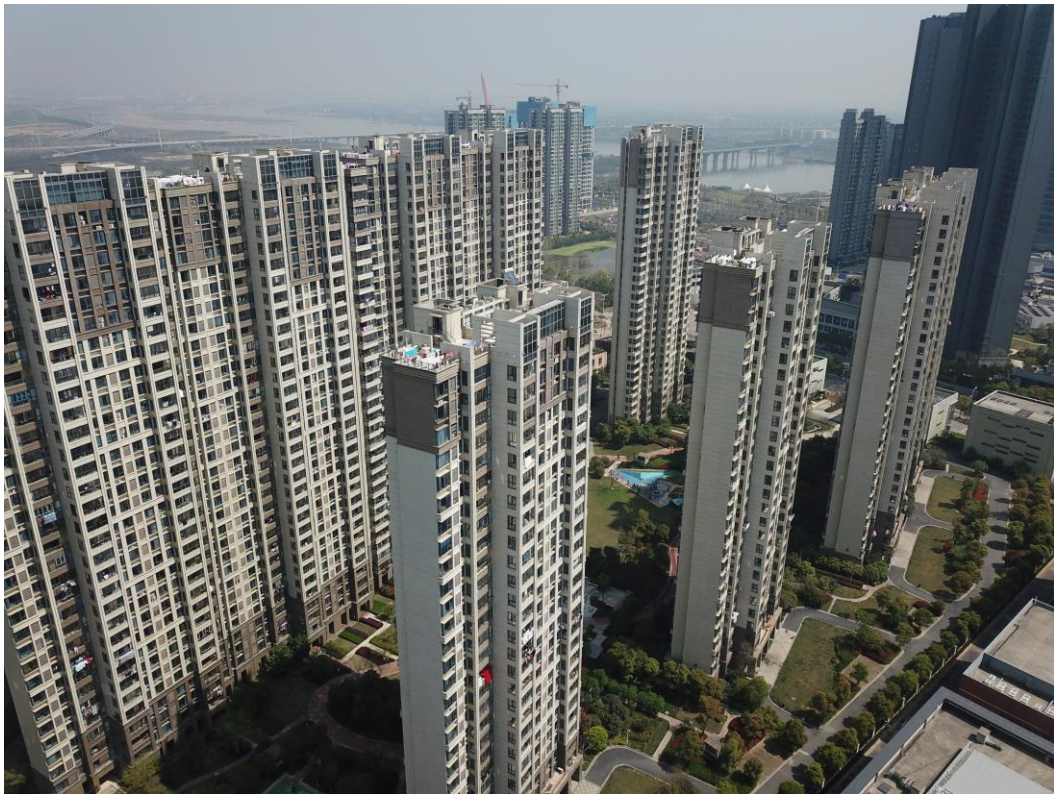
图 1-2 项目全景图（2020.2）